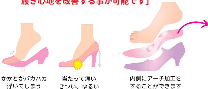
かかとがバカバカ 浮いてしまう