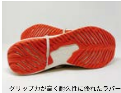
グリップ力が高く耐久性に優れたラバー

4T2 <Weekdays> 24,200円 22.0~28.5cm ユニセクス 足幅：約2E