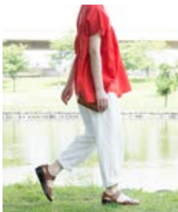
小さいサイズから大きいサイズまで展開しているオリジナルサンダル