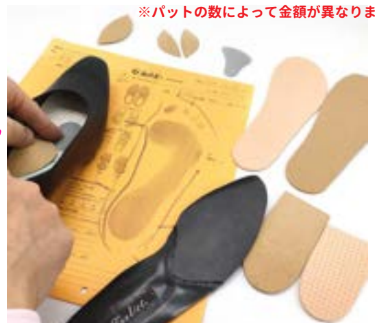
内側にアーチ加工を することができます

Q. 「自分で革靴のメンテナンスを行うのは、どうしても自信がないのですが・・・」