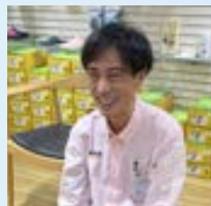
英敦之 (あべのハルカス店)