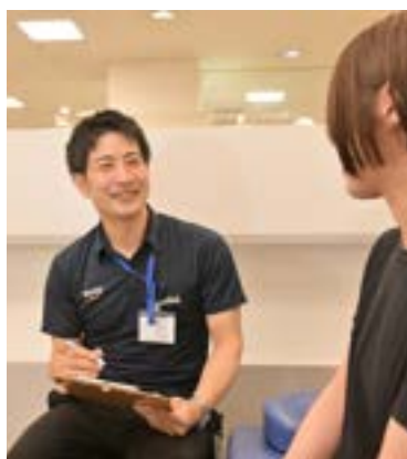
お悩み・ご要望は様々だからこそ日々の学びは欠かせない