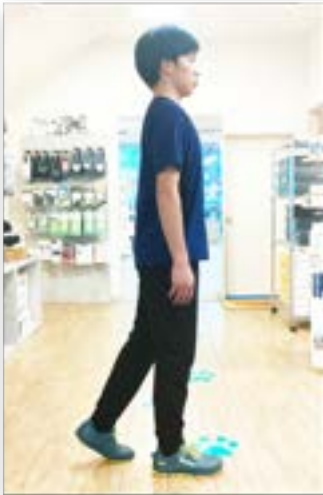
【効果その1：小股歩き】

体重を少し後ろに残すことで、自然に後ろ重心になります。これは足裏の痛みを軽減する助けにもなります。