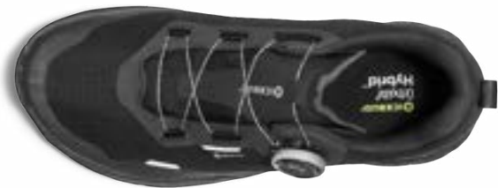
ブラック (レディース・メンズ) 22.0~28.5cm