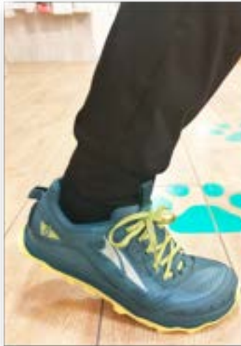
【効果その2：足指の使用】