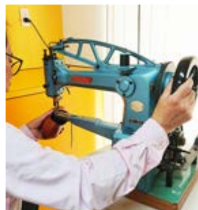
特殊ミシンを自在に操る技術力を持つスタッフ