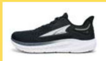
ALTRA 〈TORIN7〉 税込22,000円 レディース・メンズ

ヒールの高さが0センチのシューズブランド「アルトラ」は、今回の男性モデルも履いているブランドです。背筋を伸ばして歩きやすいので、大腰筋ウォーキングに最適！100キロウォークなど身体に負担が掛かる大会にも◎！楽歩堂各店舗で取り扱っていますので、ご試着はお気軽に♪