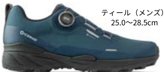
ティール (メンズ) 25.0~28.5cm