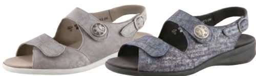
solidus 7000 税込28,080円

1910年にドイツで設立されたゾリドゥスは、 快適性・機能性・ファッション性に富んだ優れたコンフォートシューズブランド。 靴の先進国ドイツのシューマイスターから絶大な支持を得ています。