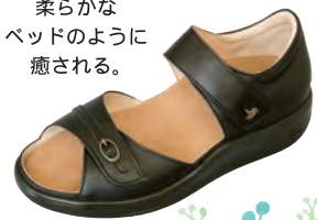
rakuhodou ASEBI 税込29,160円