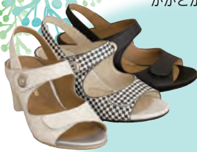
rakuhodou 6019 税込35,640円