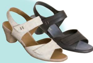
rakuhodou 227 税込30,240円