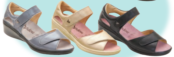
rakuhodou グラシアII 税込24,840円