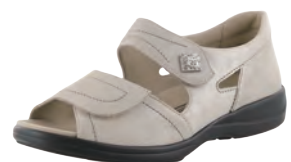
solidus 73106 税込30,240円