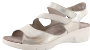
solidus 24010 税込28,080円