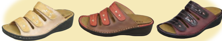
rakuhodou MILOS 税込21,600円