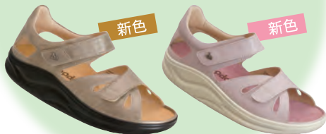
rakuhodou Flowlyサンダル 税込29,160円