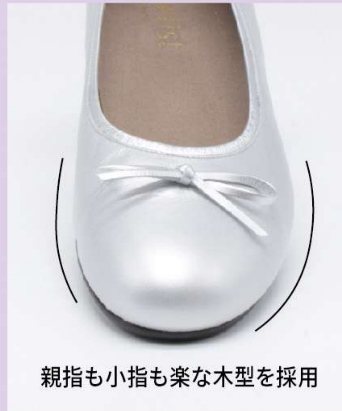
親指も小指も楽な木型を採用

一日中履いても楽々♪ つま先底の低反発スポンジが足裏の負担を和らげるとともに、脱着可能なインソールは偏平足や外反母趾にも対応したアーチサポート設計です。