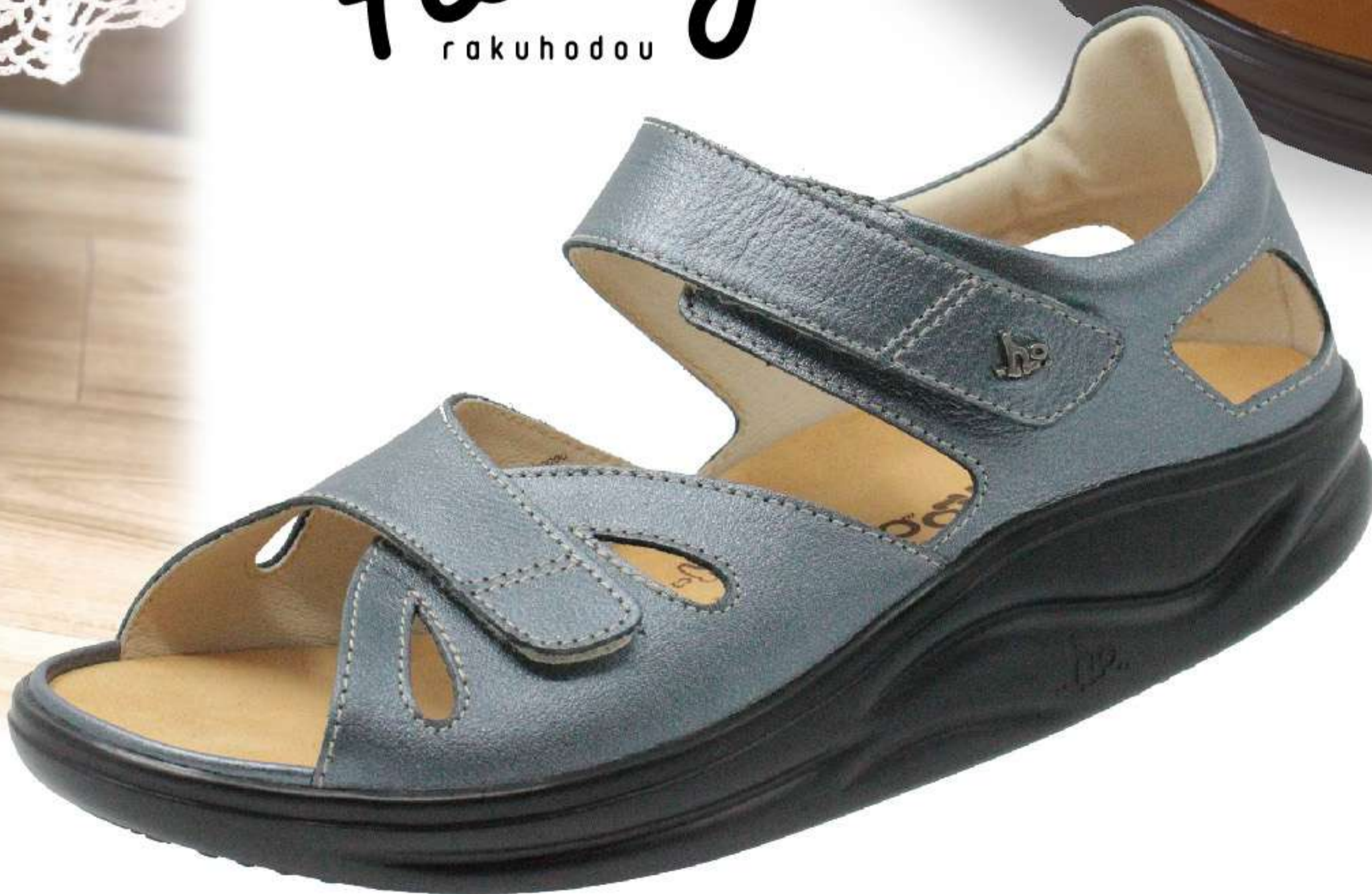
ブルーメタリック