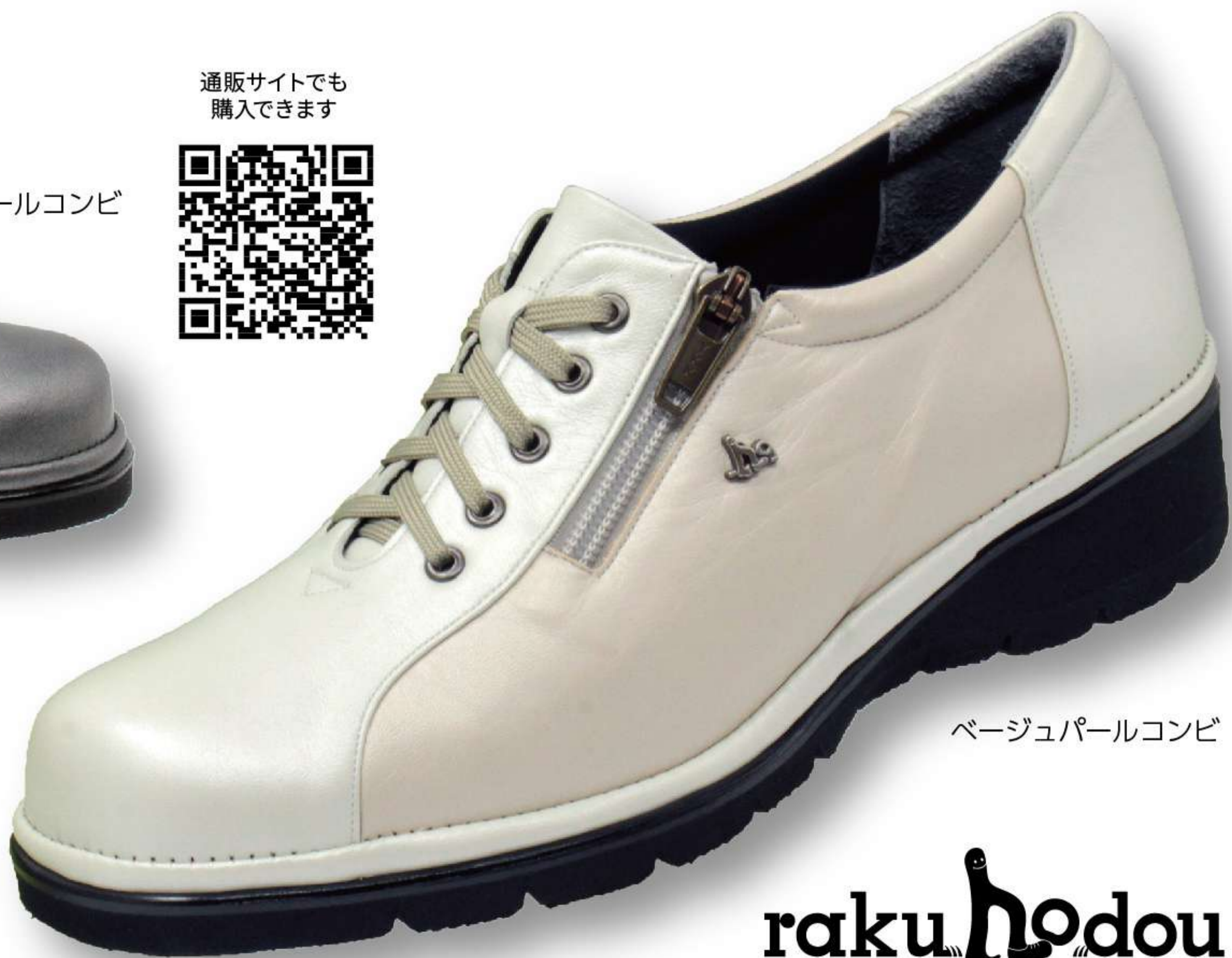
ベージュパールコンビ