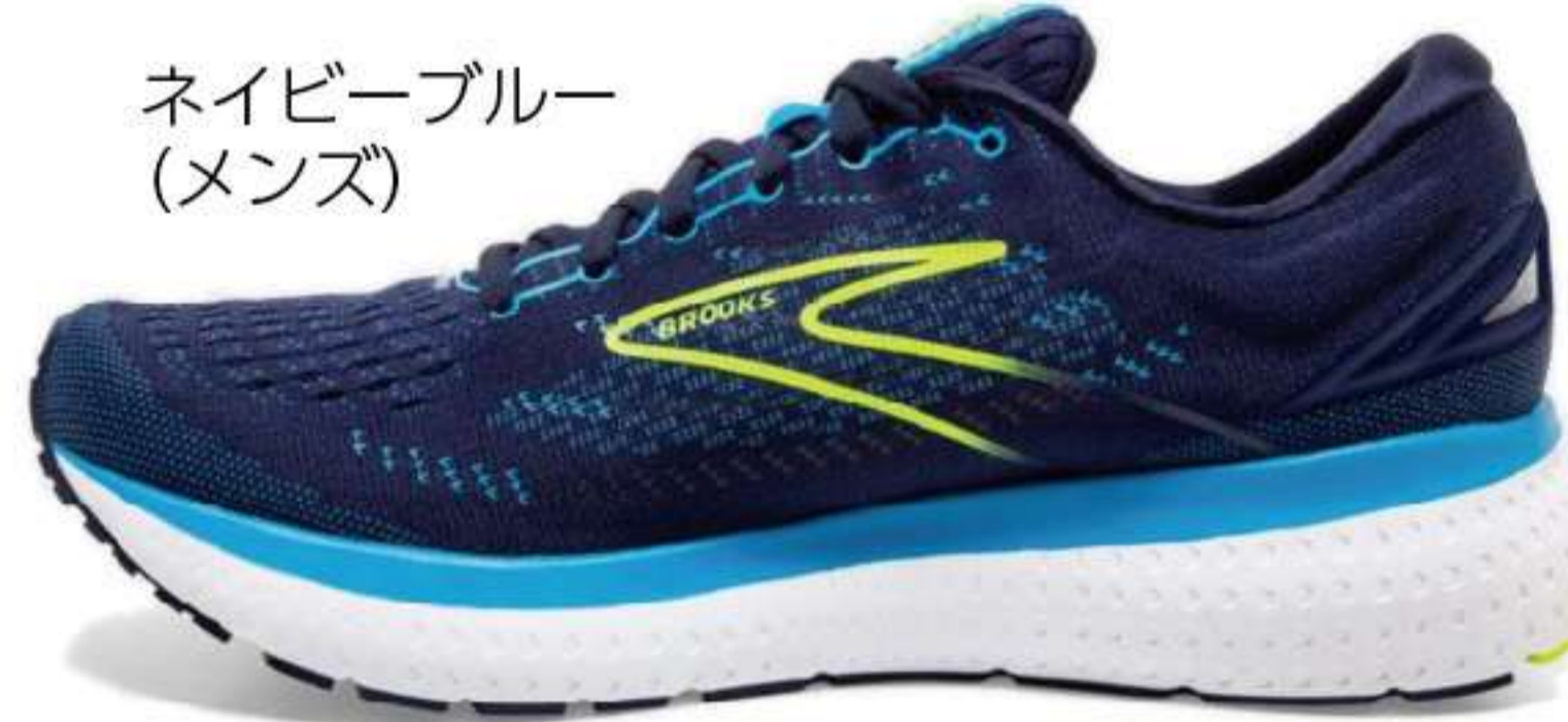
ネイビーブルー (メンズ)