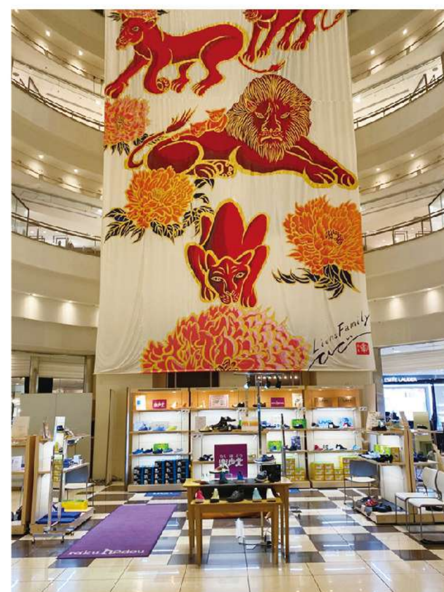
仙台三越館内の迫力あるライオン画の前で販売イベントを開催。全国各地の商業施設で販売イベントを開催しております。