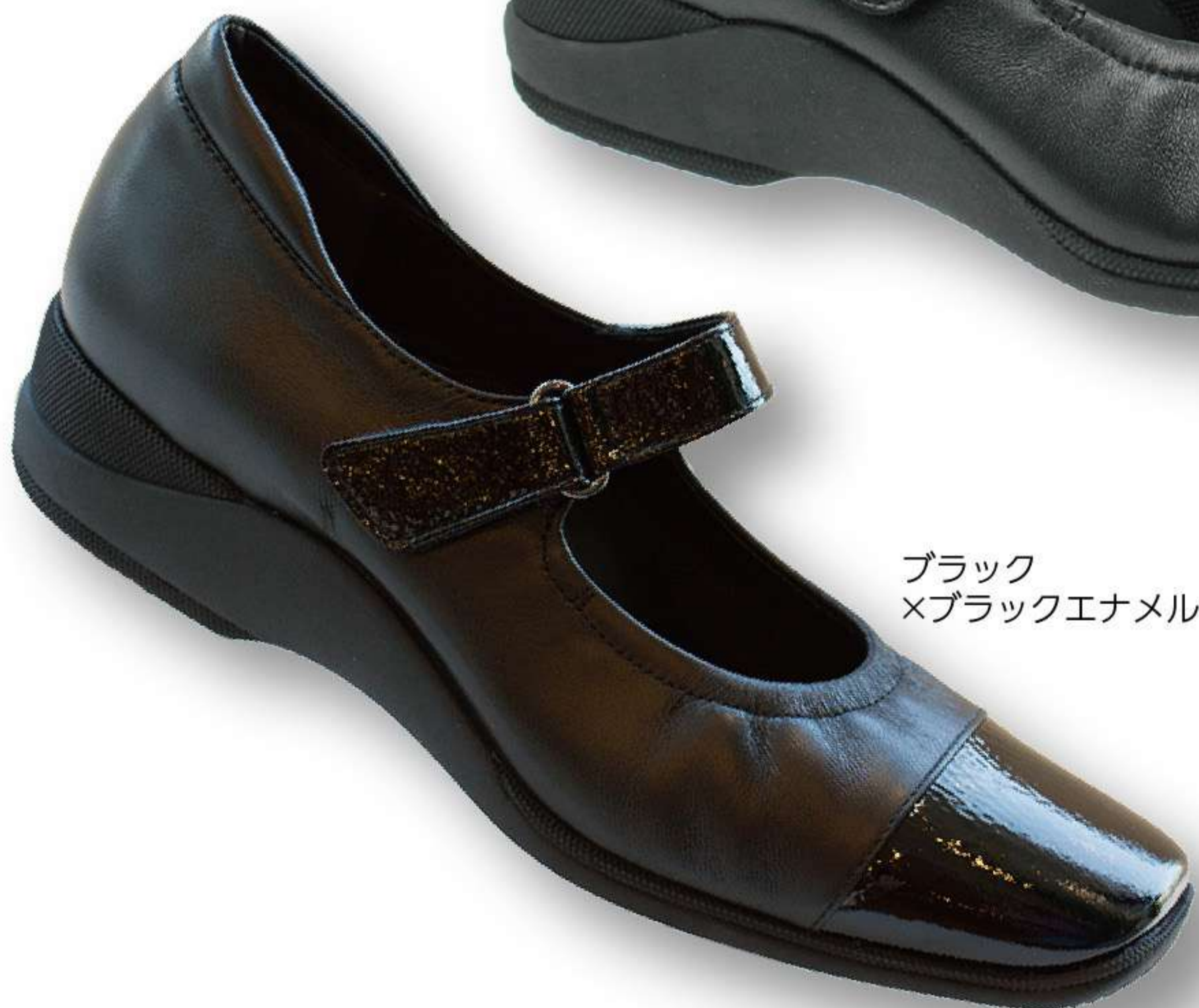
ブラック ×ブラックエナメル