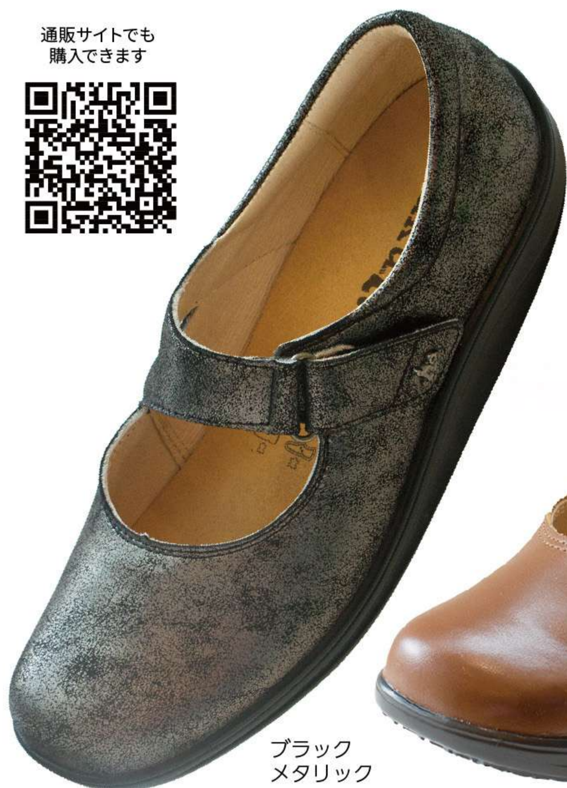
ブラック メタリック