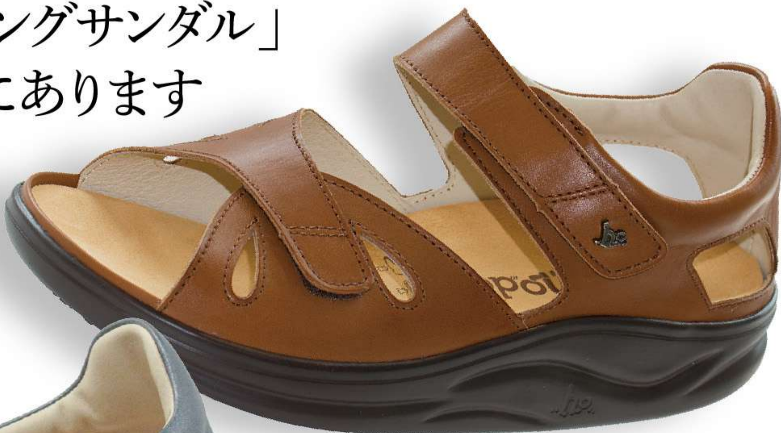
メープルブラウン