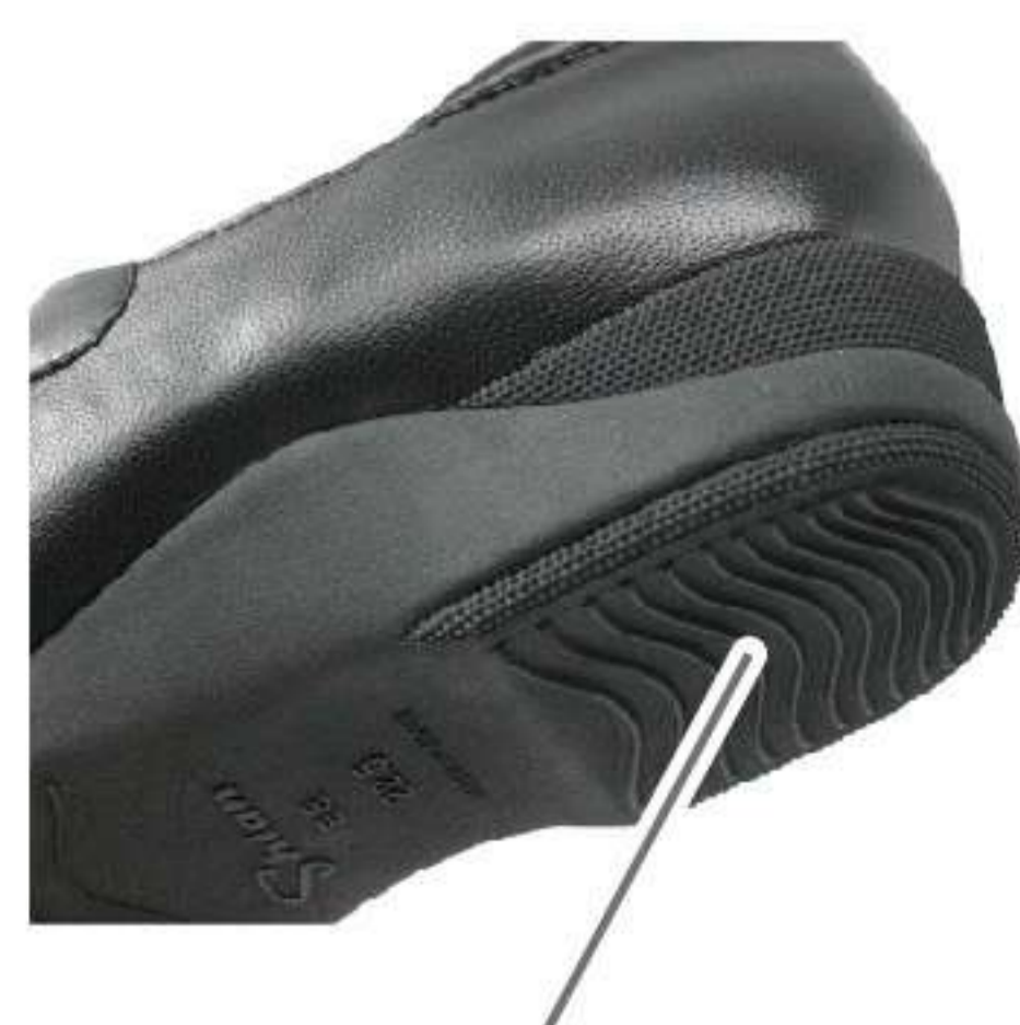
ゴム底なので 雨で滑りにくい

雨にも強いから嬉しい♪ 耐水性のある上質で柔らかい革を使い、クッション性があるゴム底が濡れた路面でもしっかりと効くので、多少の雨でも大丈夫です。