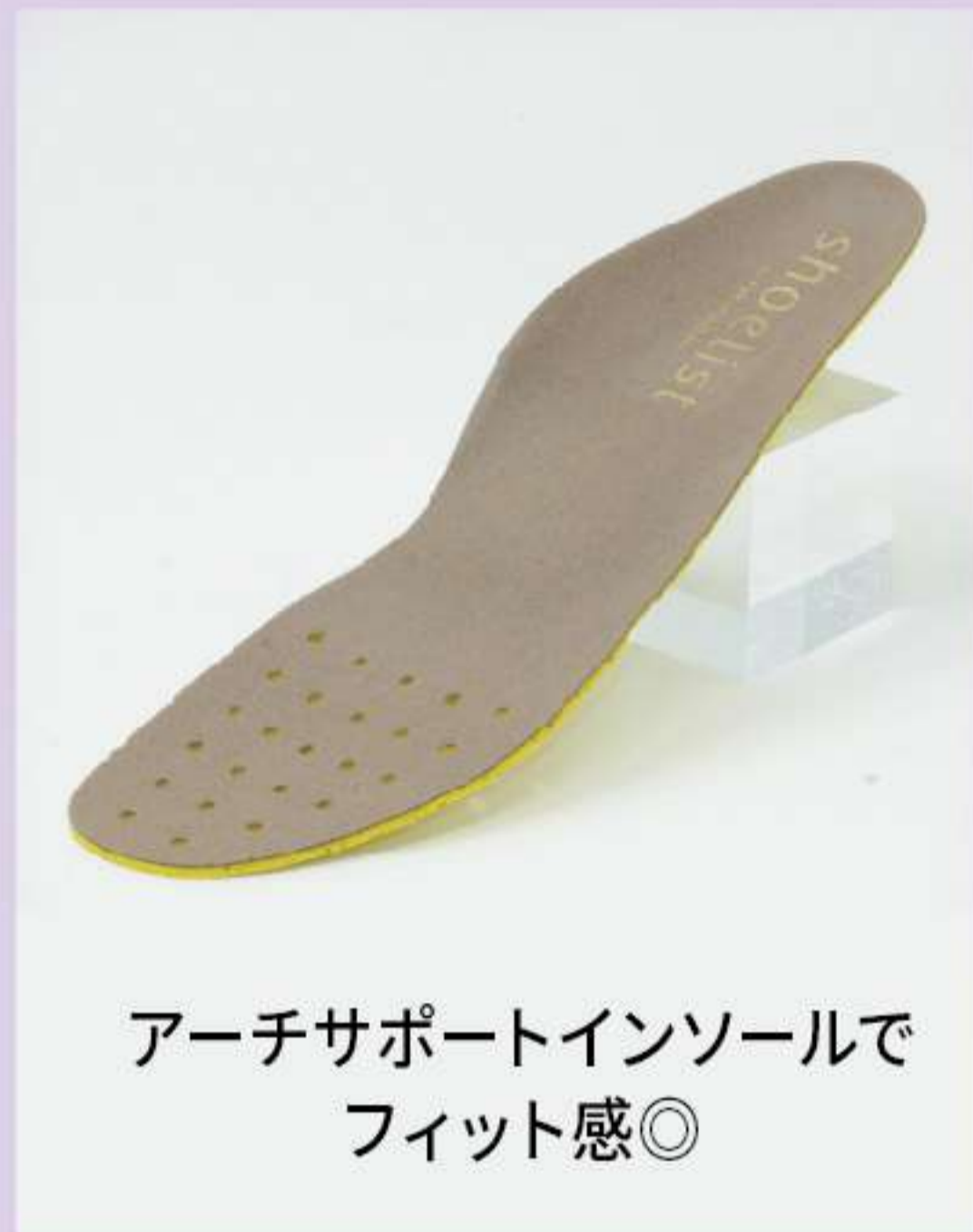
アーチサポートインソールで フィット感◎

一日中履いても楽々♪ つま先底の低反発スポンジが足裏の負担を和らげるとともに、脱着可能なインソールは偏平足や外反母趾にも対応したアーチサポート設計です。