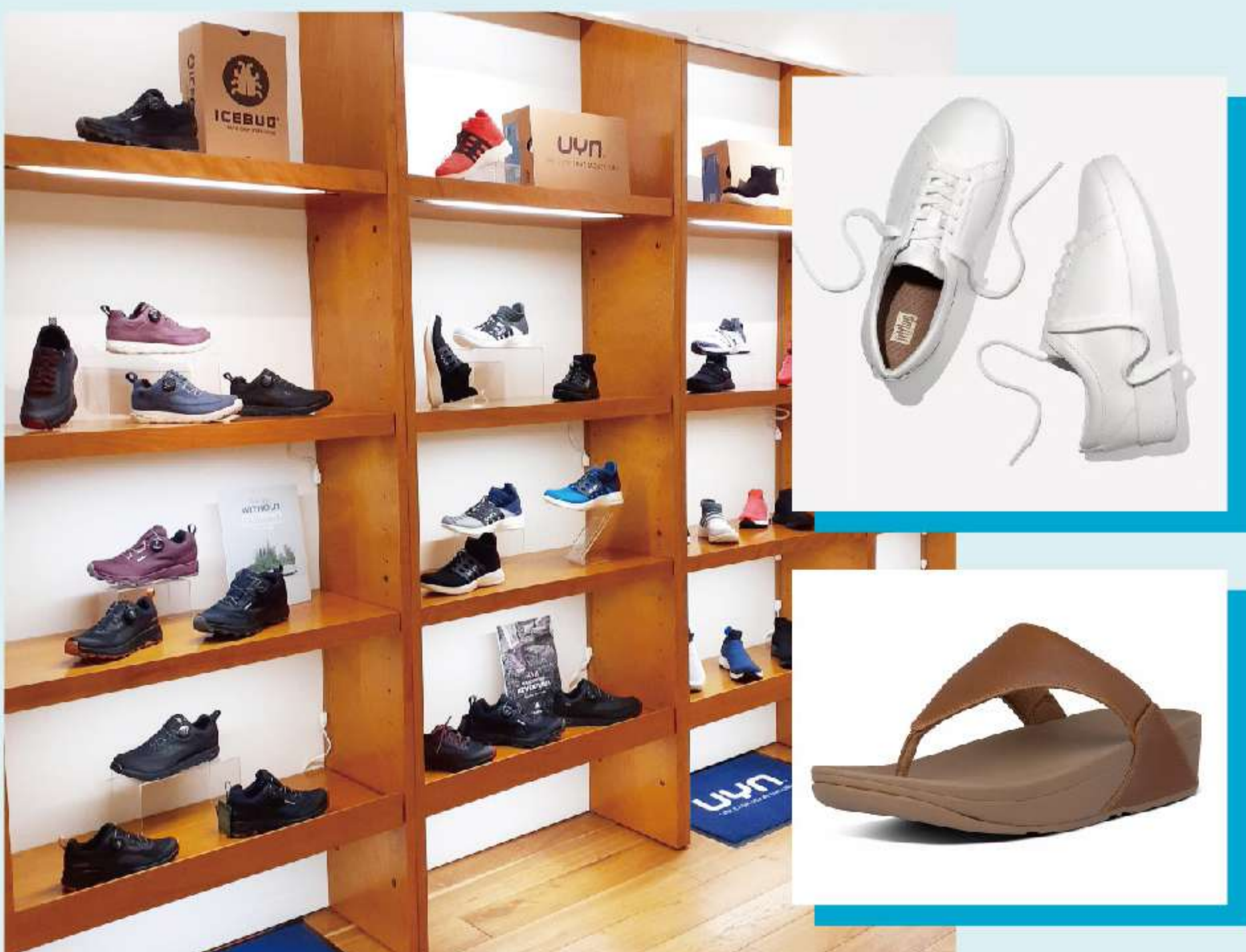
UYN/fitflop 大丸梅田店 4階 婦人靴売場内