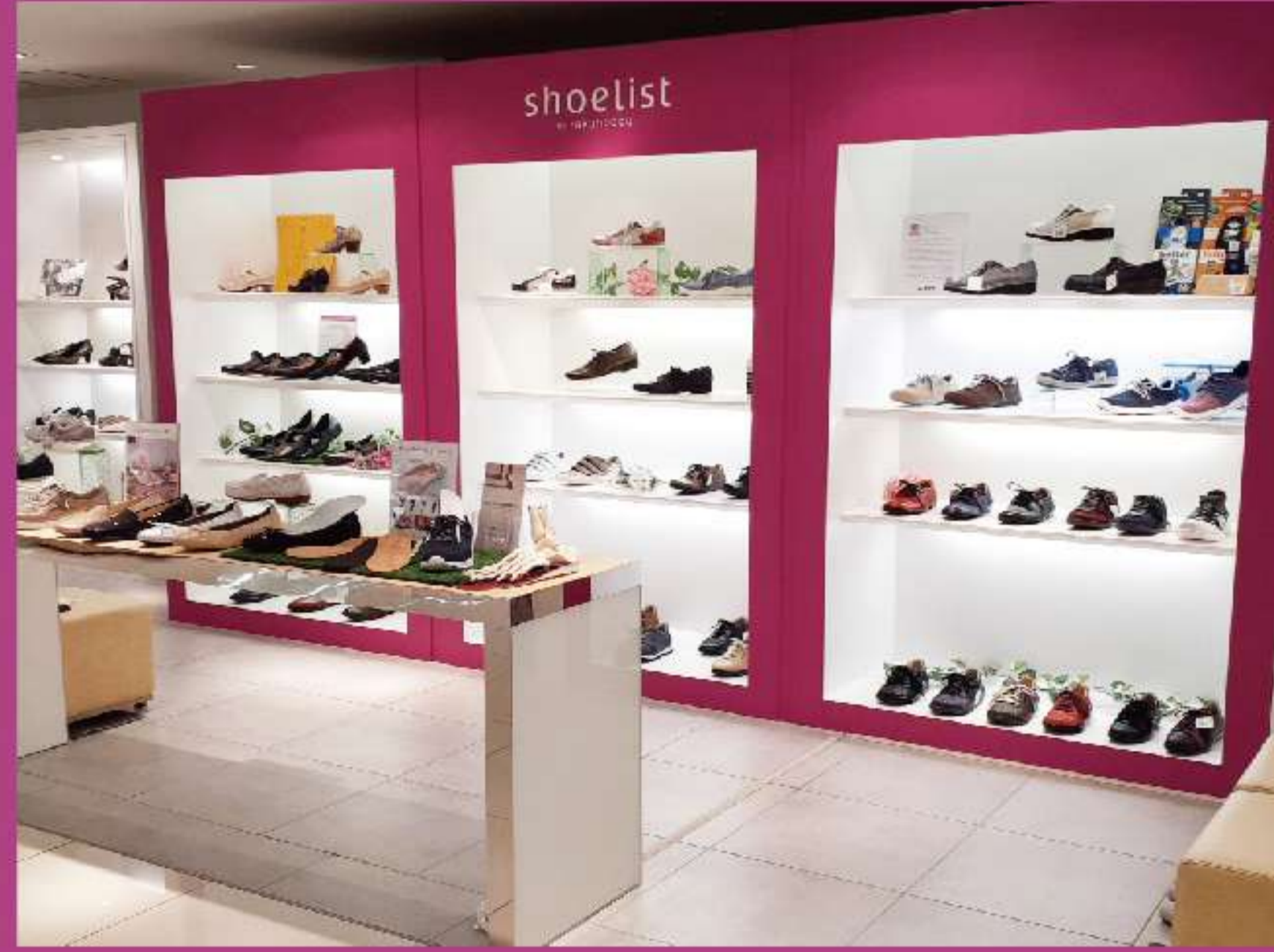
小田急新宿店 本館3階 婦人靴売場内