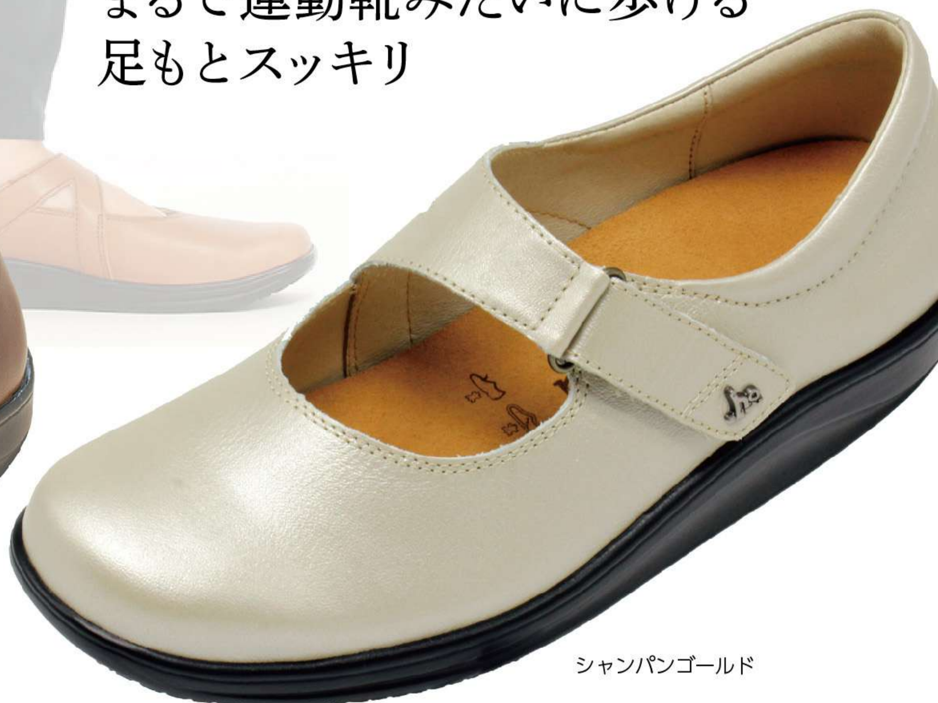
シャンパンゴールド