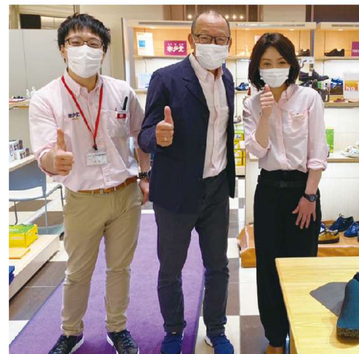
元気な仙台三越店スタッフとともに。感染予防対策を万全に営業しております。

今後も皆様の街へ、積極的に店舗展開していく考えです。楽歩堂の出店にぜひ、ご期待ください。