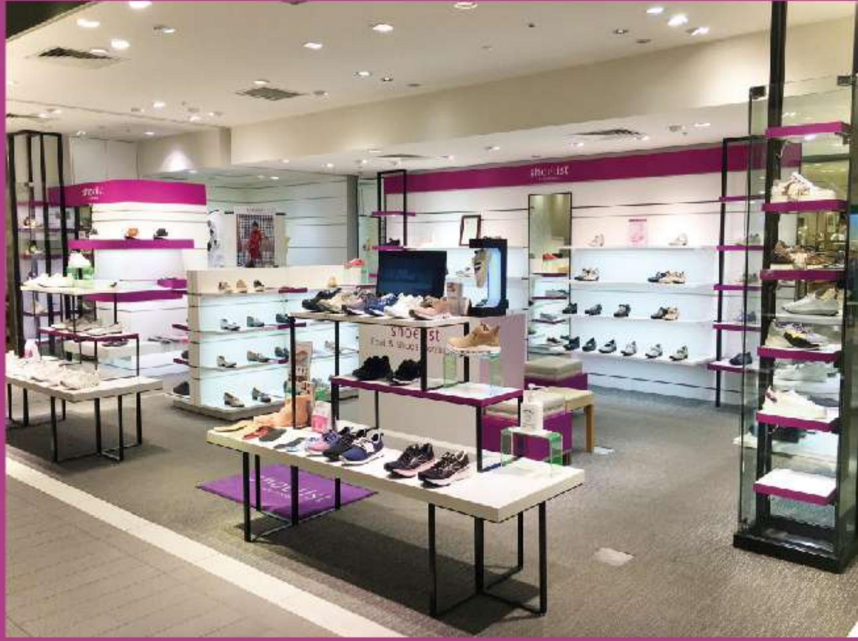
大丸梅田店 4階 婦人靴売場内