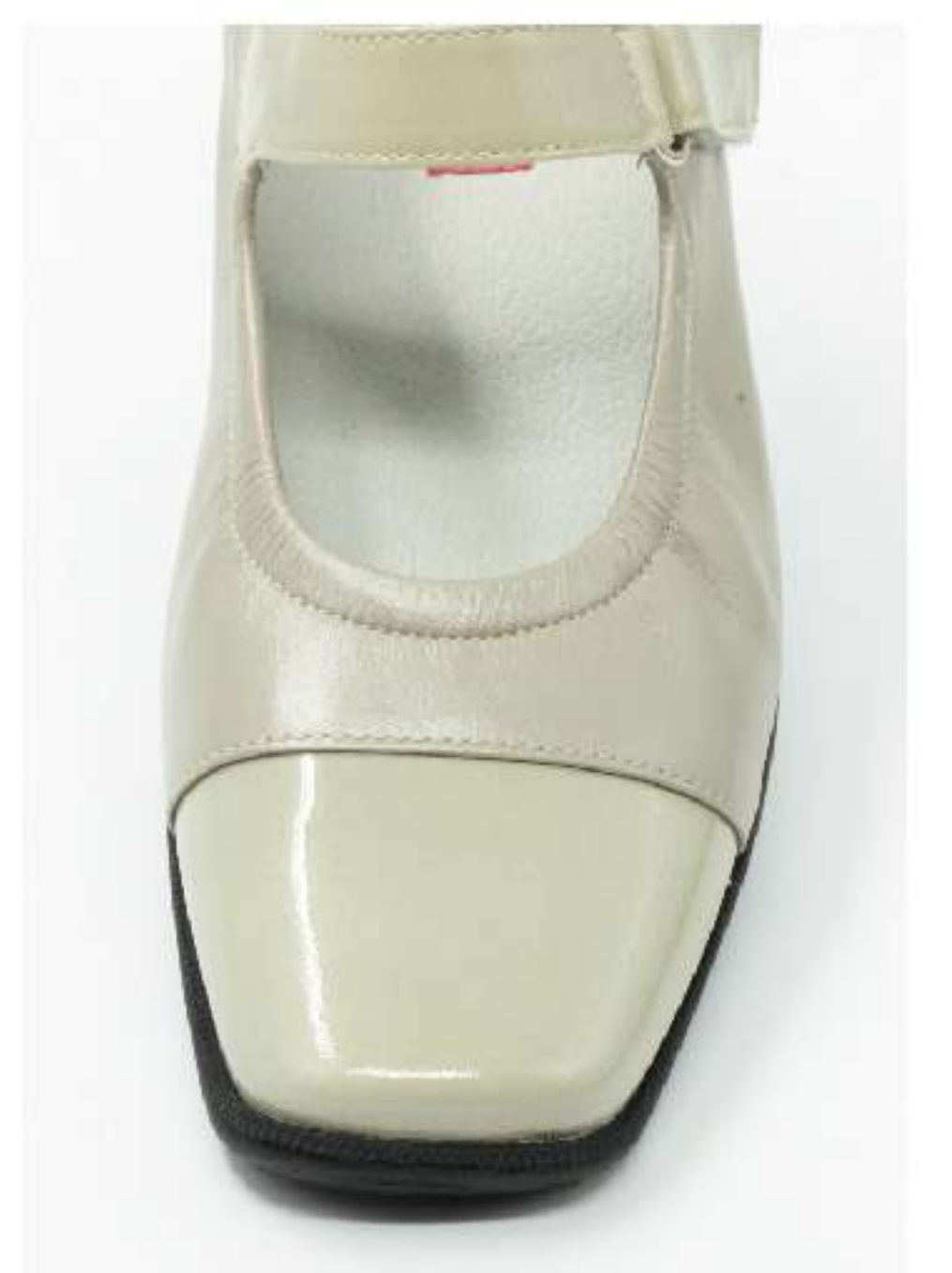
清楚な印象のスクエアトゥ

大活躍間違いなし! きれいなカジュアルもお仕事も 2E幅ですっきりとしたシルエットなのに、ソフトレザーが足を優しく包んでくれるので、つま先ラクラク。裏地はニット素材を使用しているため、ストッキングでもソフトで快適な足当たりです。 履き口回りにはゴムが入り、甲のストラップと相まってフィット感抜群です。