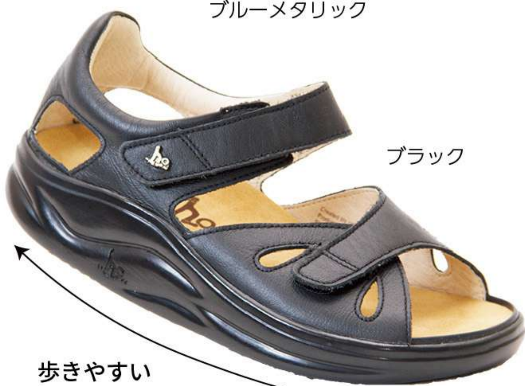
歩きやすい 揺りかごソール

何より歩きやすさが一番! 丸みを帯びた揺りかごソールが正しい歩行へと導き、サンダルとは思えない歩きやすさと疲れにくさを実現しました。理想的なウォーキングを可能にした一足です。 どんなに幅広足でもOK 約4E幅で、しかもつま先のベルトは幅が調節できるから、どんなに足幅が広く、甲が高い足でも履けます。外反母趾・開張足でお悩みの方も、迷ったらコレを選んでおけば、後悔はしません! 低反発クッションを内蔵 コルク配合素材と低反発クッション素材を組み合わせたアーチサポートインソールが、足裏に吸いつくようにフィットして、足の疲れやトラブルを予防します。