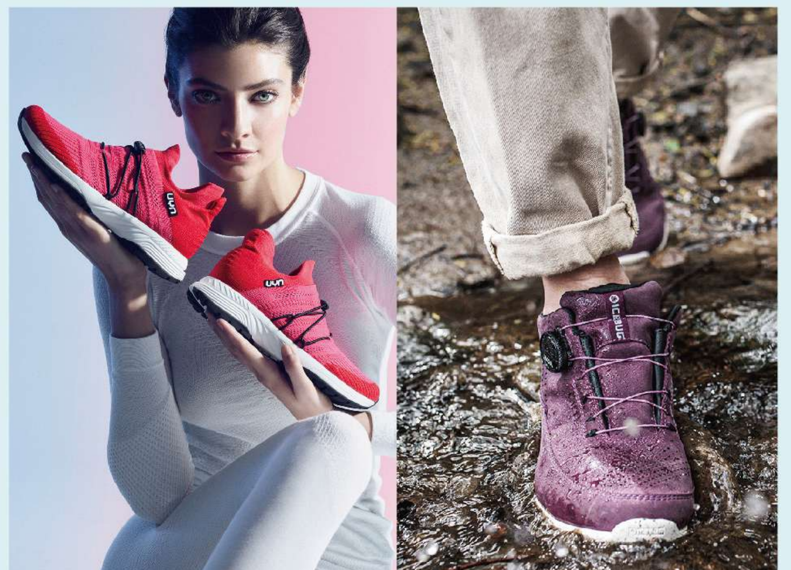
UYN/ICEBUG 小田急ハルク店 楽歩堂 run & walk 小田急ハルク店がリニューアルしました