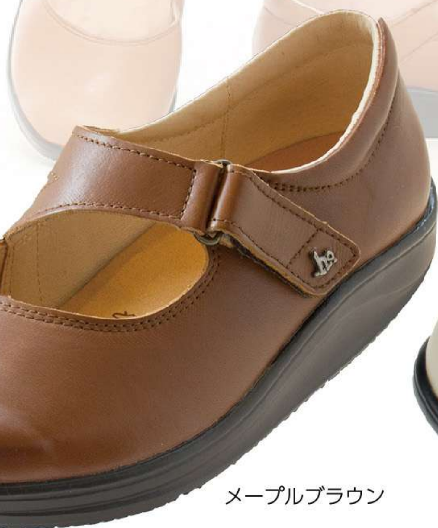
メイプルブラウン