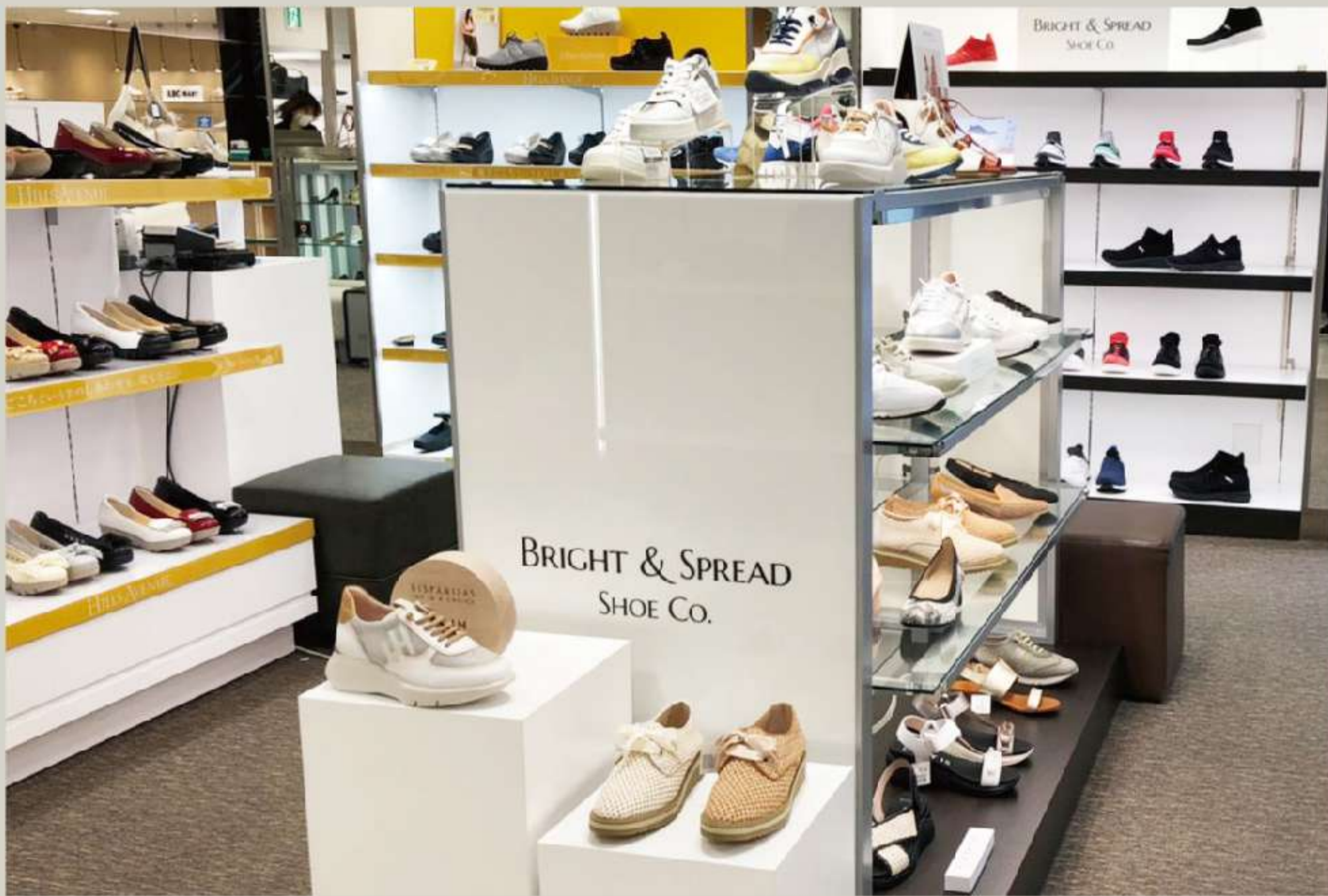
松坂屋名古屋店 南館 地下2階 婦人靴売場内