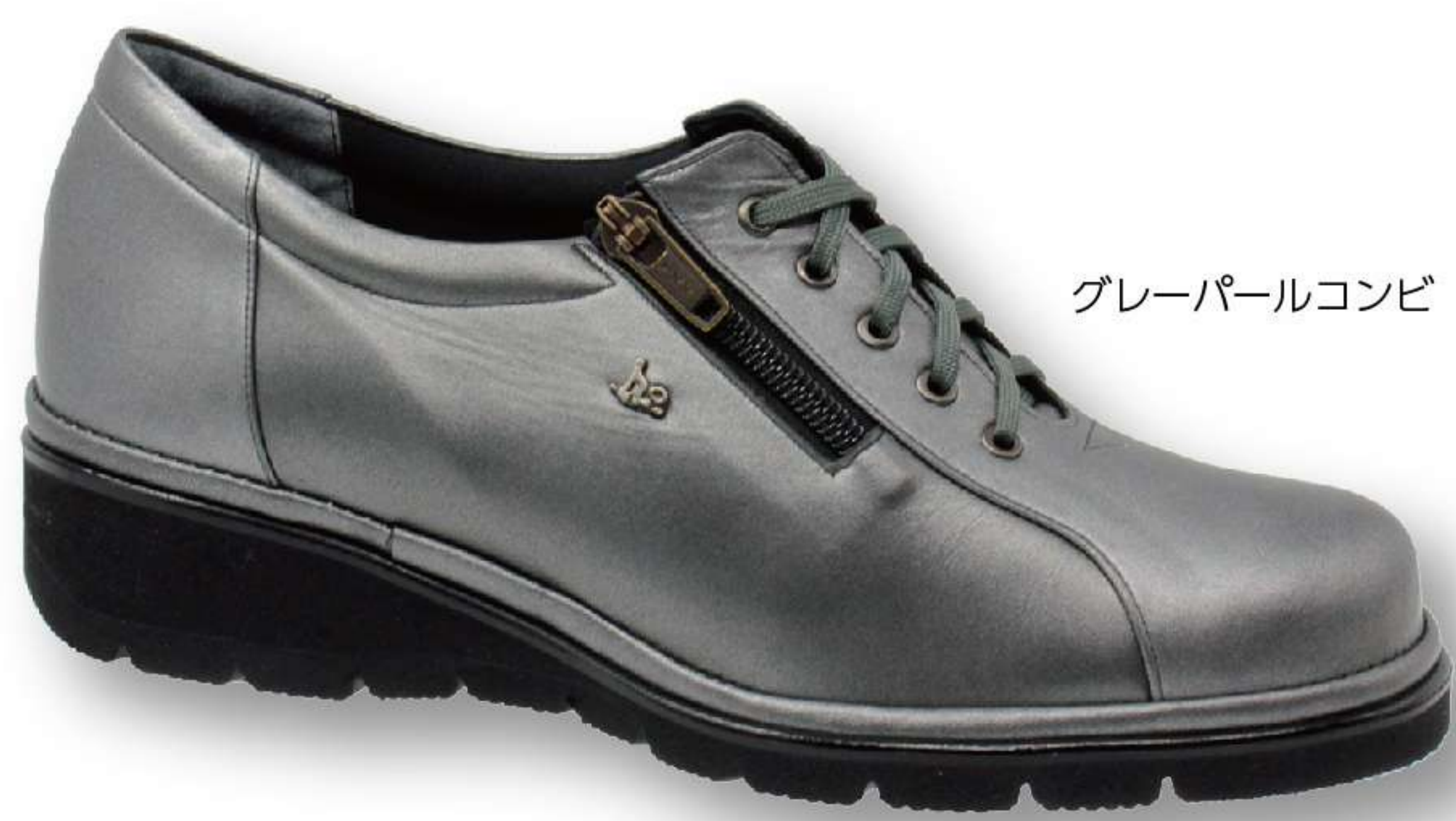
グレーパールコンビ