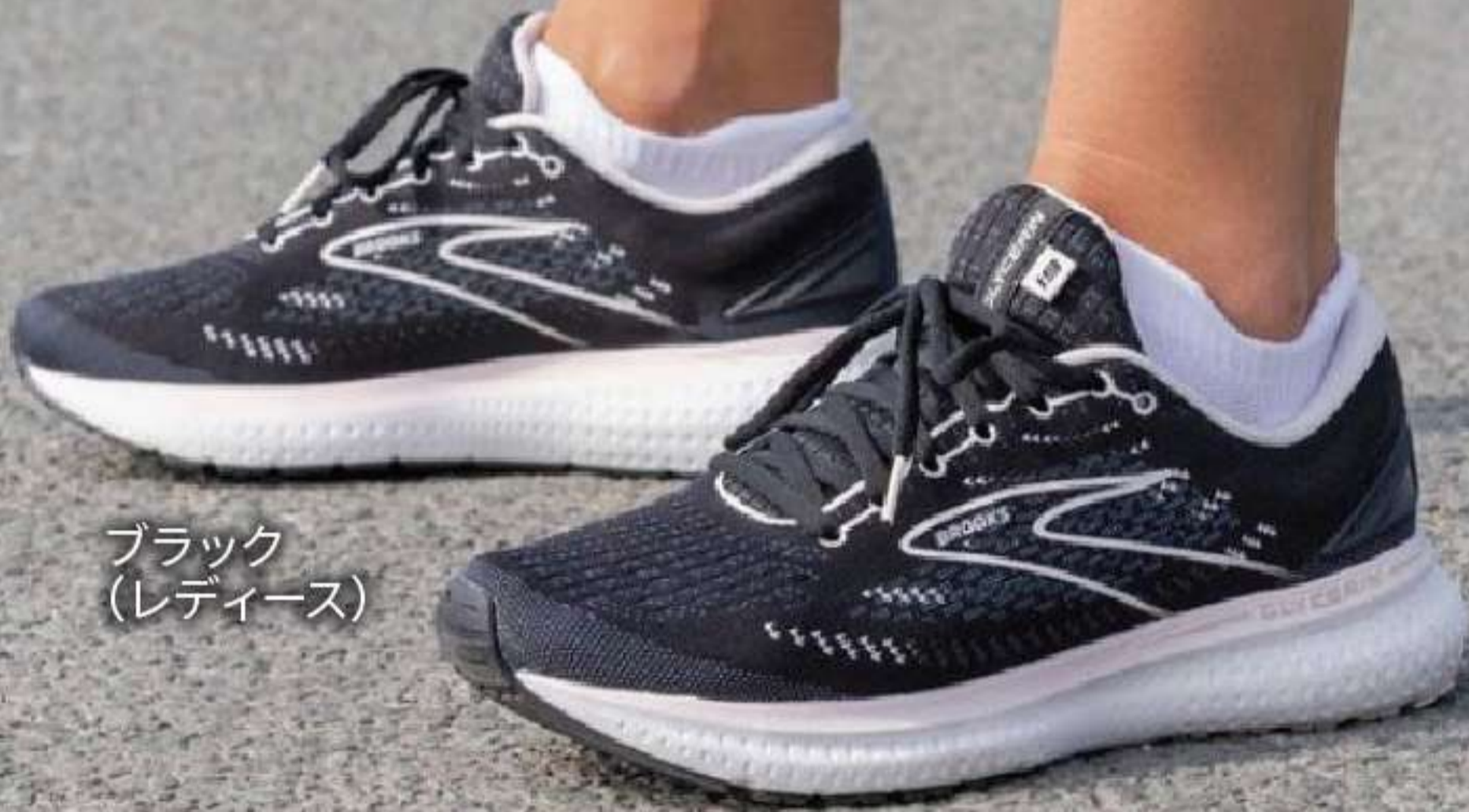
ブラック (レディース)