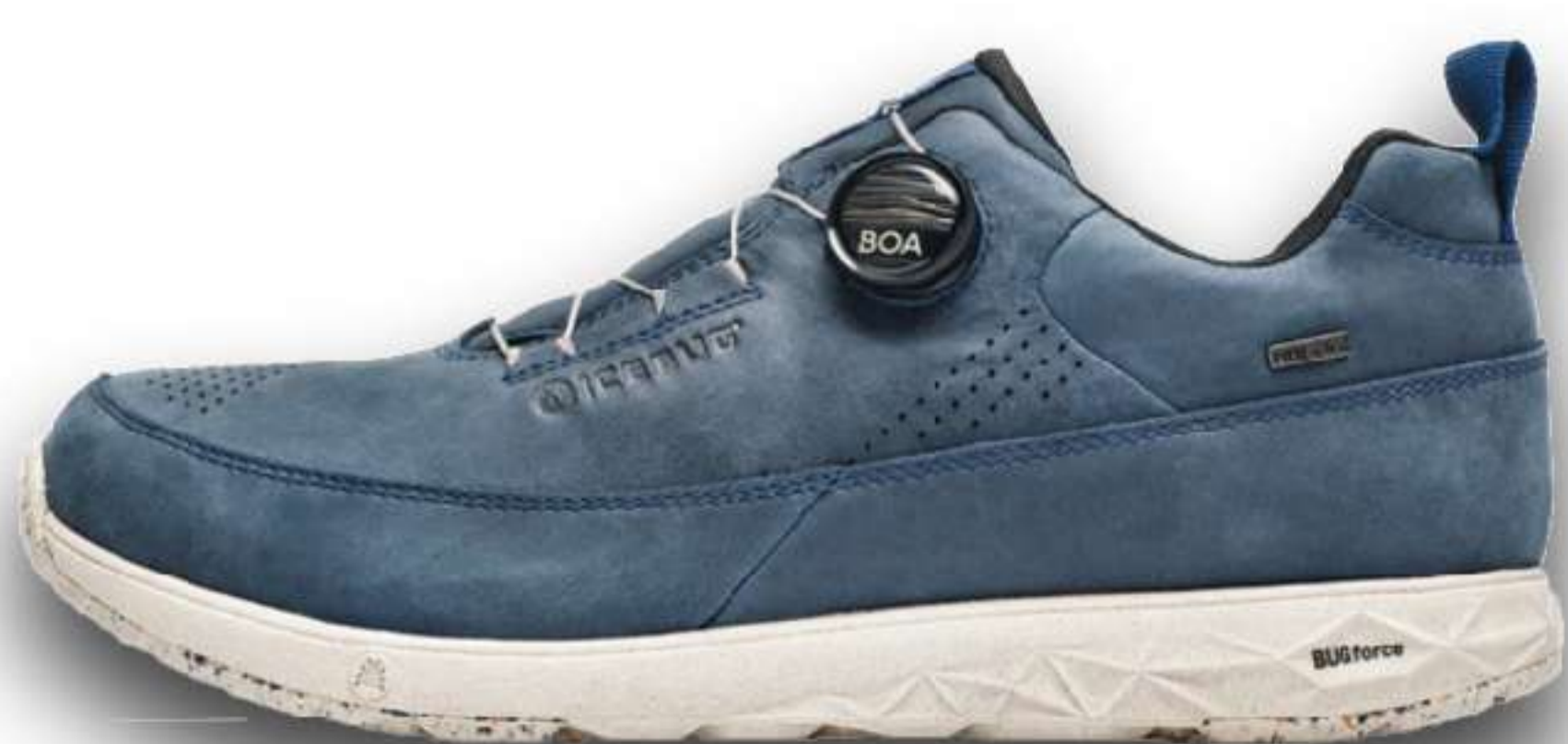
Hike & Explore ICEBUG AVA RB9X®