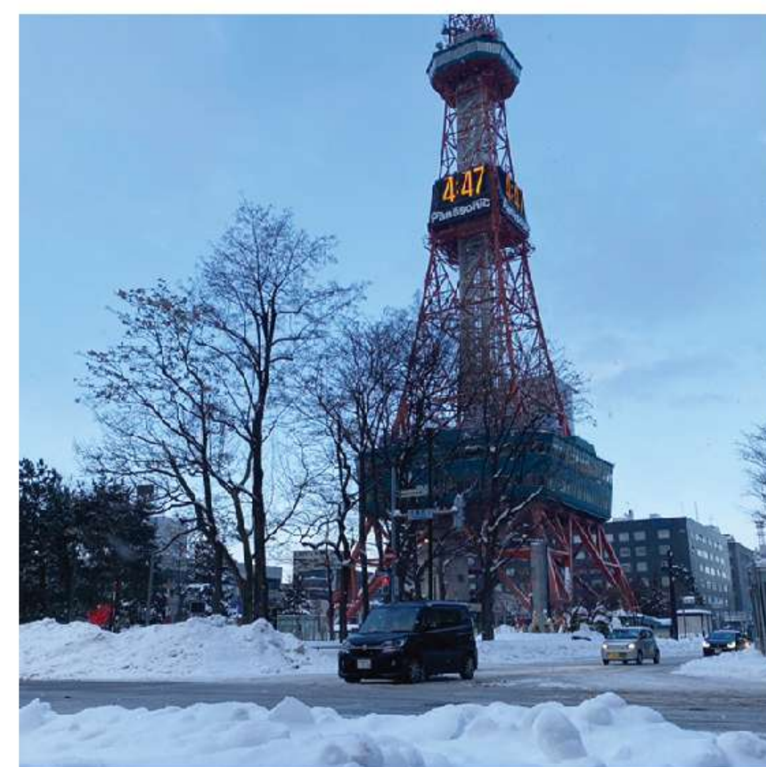
天候が荒れた翌日に札幌店がオープン。思った以上に寒く、少し凍えながら撮影。