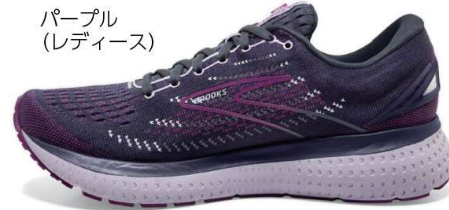
パープル (レディース)