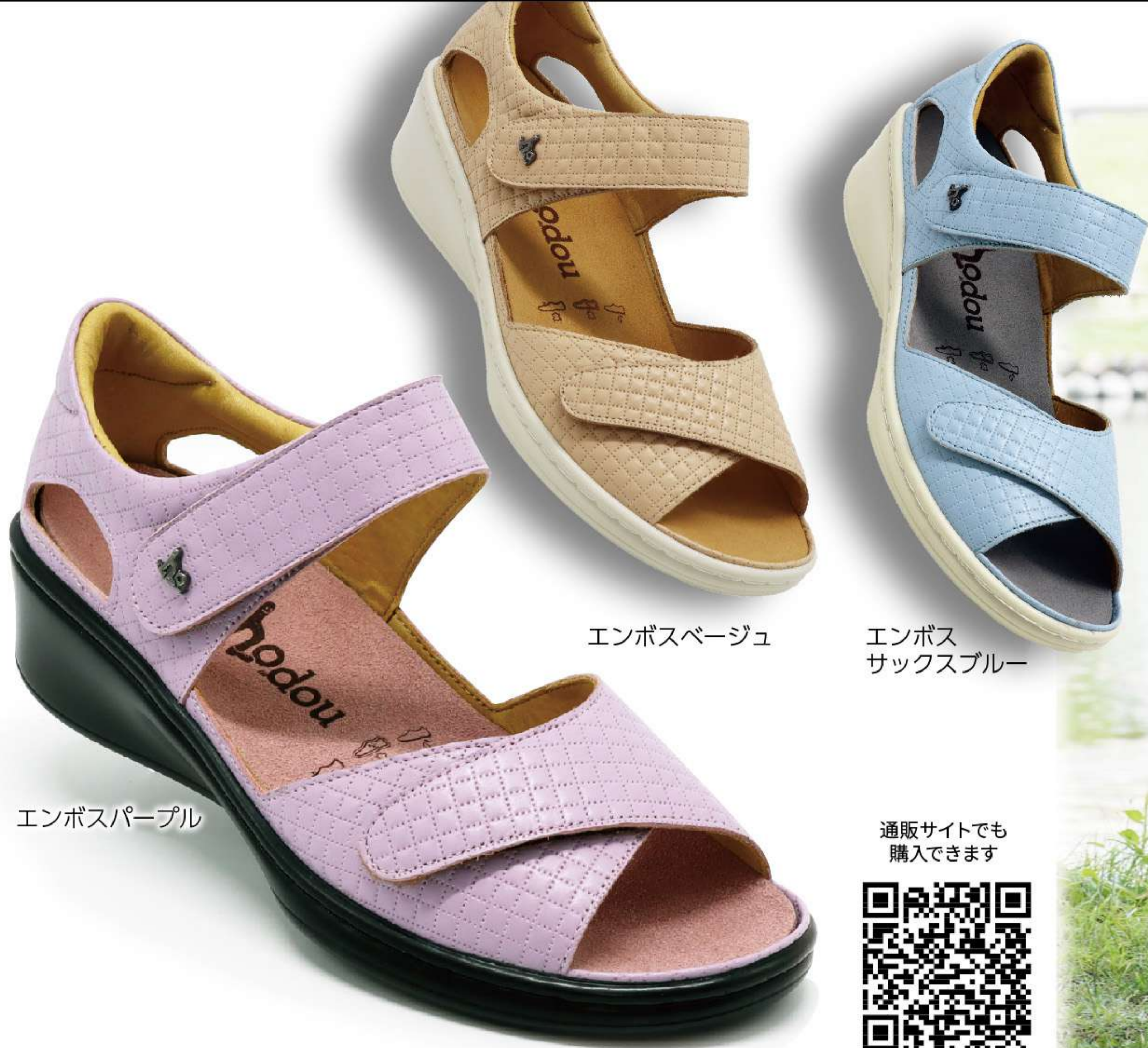
エンボスパープル