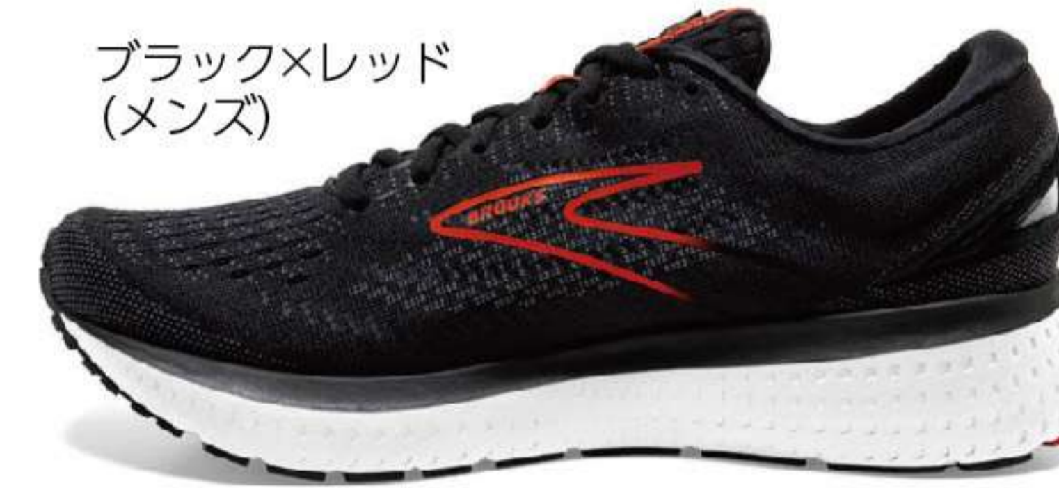
ブラック×レッド (メンズ)