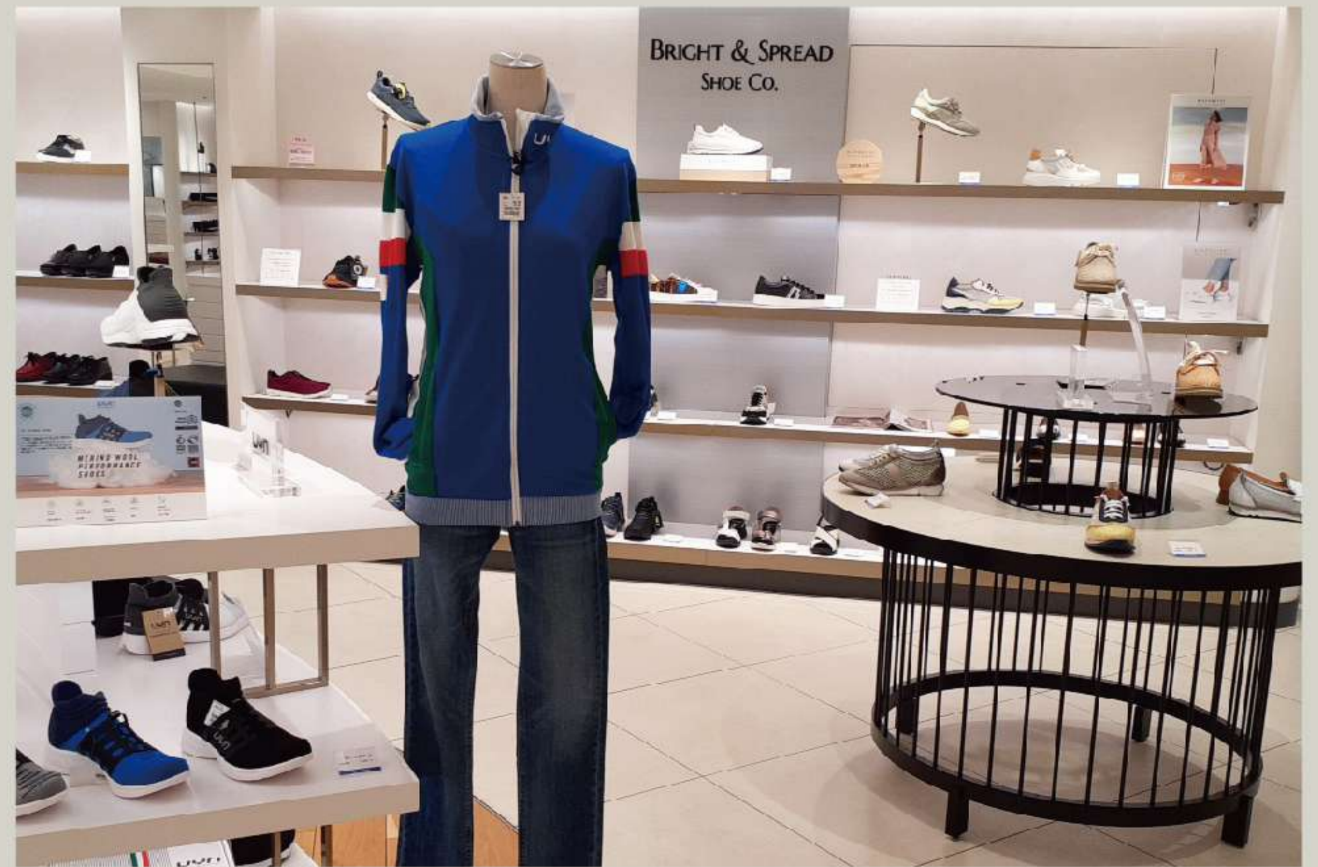
名古屋栄三越店 3階 婦人靴売場内