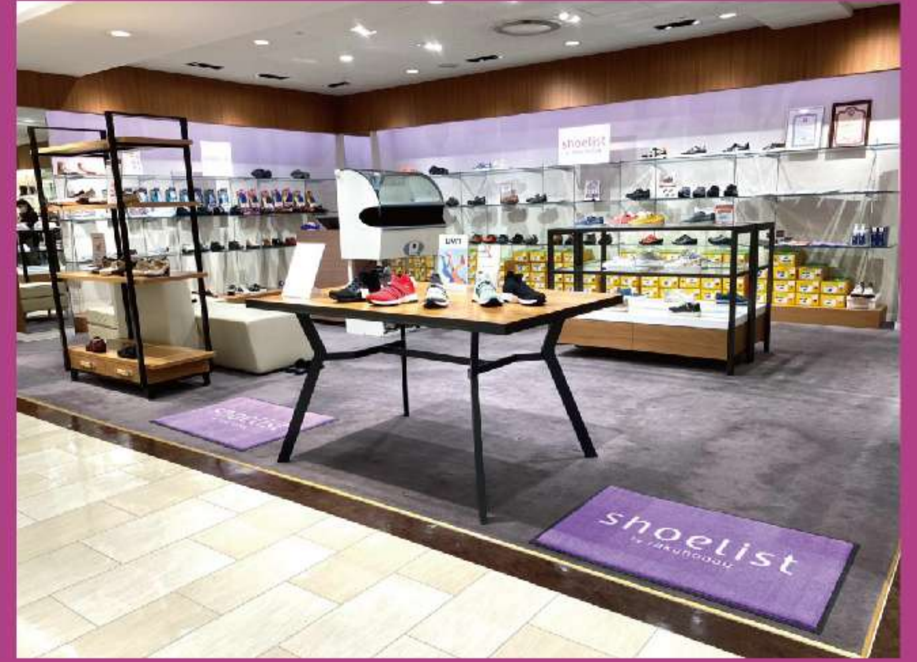
丸井今井札幌本店 2階 婦人靴売場内